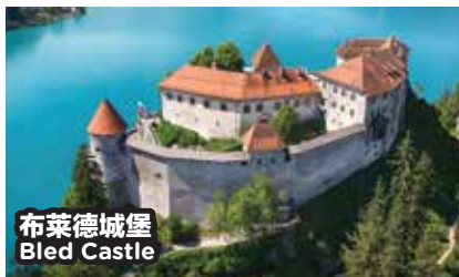
布莱德城堡 Bled Castle