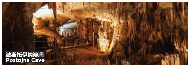
波斯托伊纳溶洞 Postojna Cave