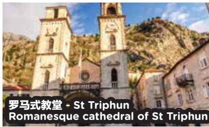
罗马式教堂 - St Trihun Romanesque cathedral of St Trihun