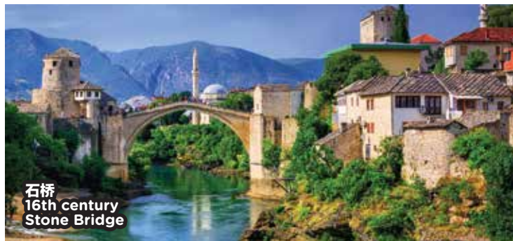
石桥 16th century Stone Bridge