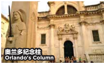
奥兰多纪念柱 Orlando's Column