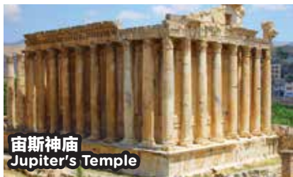
宙斯神庙 Jupiter's Temple