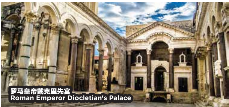
罗马皇帝戴克里先宫 Roman Emperor Diocletian's Palace

· 倘若原定的景点不对外开放，将由其他景点取代。 · 以上的景点先后顺序可根据具体的情况有所调整。 · 在主要节日，商业展览，旅游旺季期间，住宿酒店可能需要安排在另一个城市。